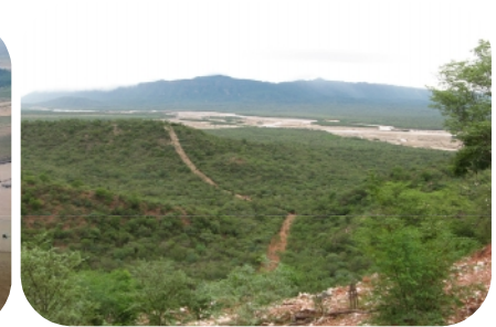
Erosión de los suelos en la cuenca