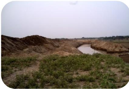
Extracción de áridos