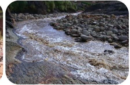
Contaminación minera en la cuenca alta