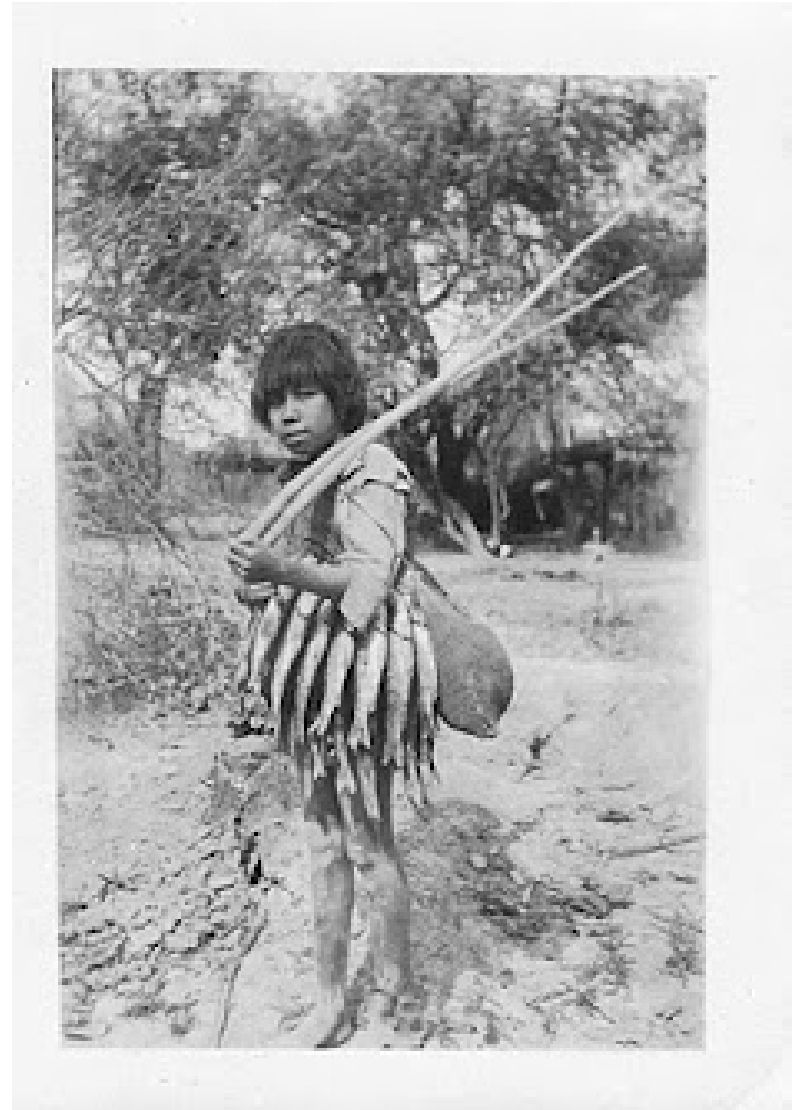
Niño pescador (foto 1930)

La narración más resaltante es “La Matanza del Algodonal” (1915), que habría tenido lugar en una localidad del mismo nombre cerca de Crevaux. Esta historia cuenta que un grupo de militares y criollos tendieron una emboscada en la cual asesinaron a varios líderes Weenhayek.