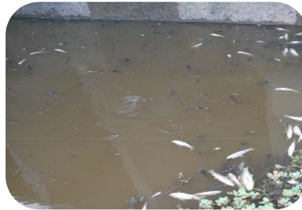
Obras y proyectos sobre el cauce del río