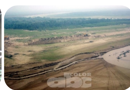
Colmatación del cauce