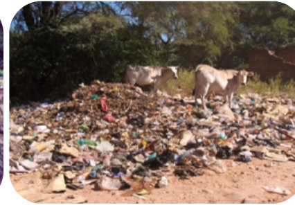
Contaminación urbana en los afluentes del río Pilcomayo