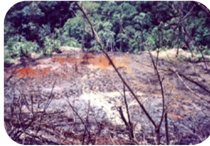
Actividad petrolera en la cuenca media